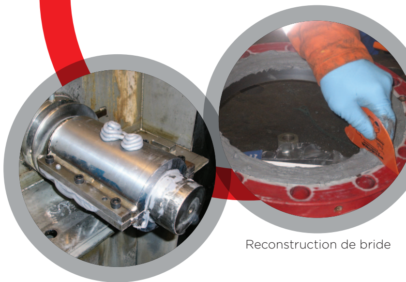
Moulage d'arbre in situ