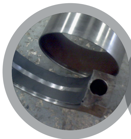
Reconstruction de logement de roulement