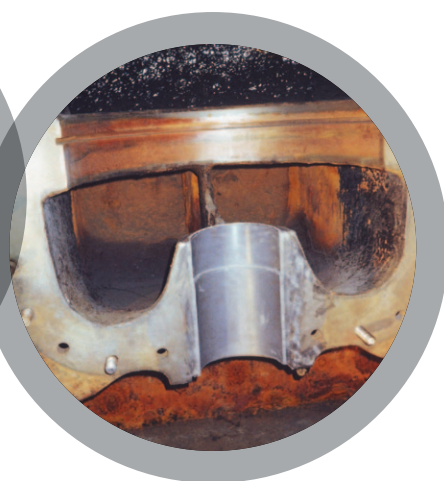
Moulage de logement de garnitures