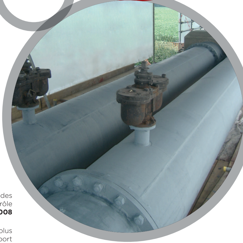
Collage de plaque

Pour de plus amples informations, veuillez vous référer à: