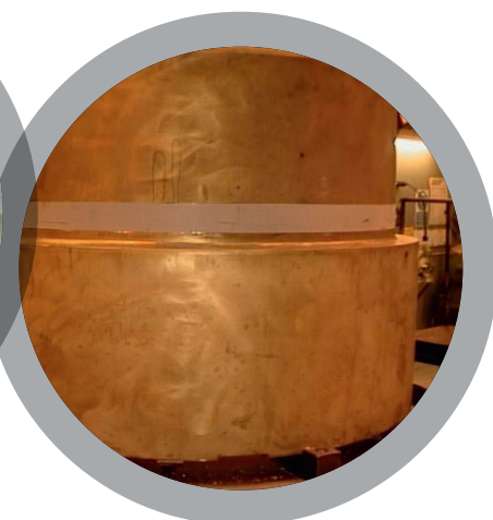
Reconstruction de piston