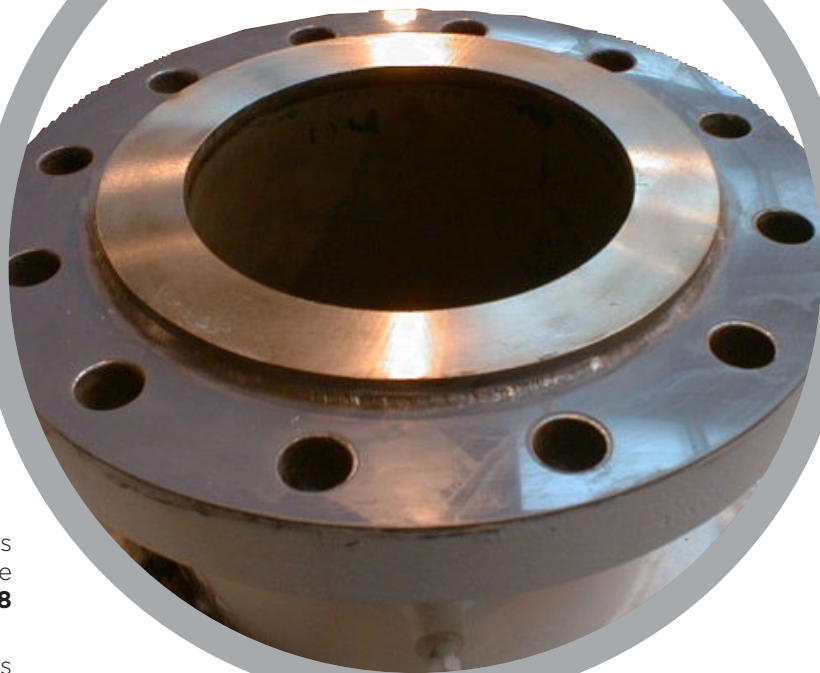
Faces de brides

Pour de plus amples informations, veuillez vous référer à: