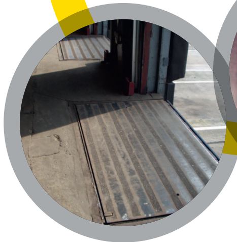
Niveleurs de quai