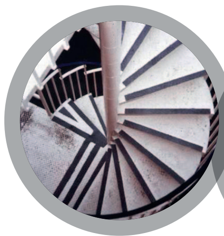
Escaliers de secours