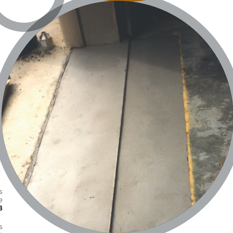
Surfaçage de sols

Pour de plus amples informations, veuillez vous référer à: