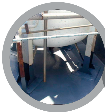
Cuves de rétention de produits chimiques