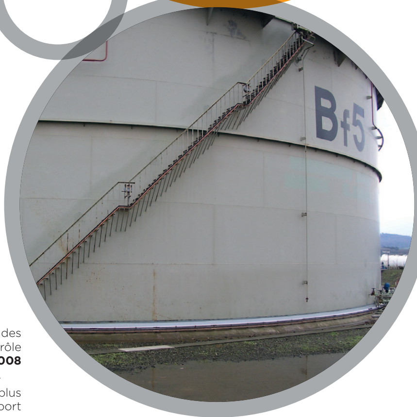
Réservoirs de stockage de produits chimiques

Pour de plus amples informations, veuillez vous référer à: